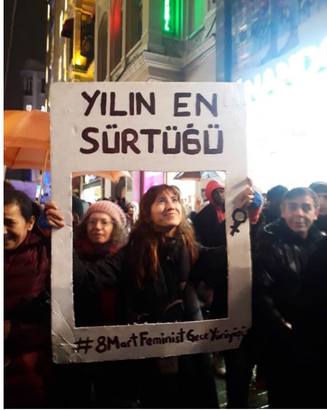
Şekil 4. Feminist gece yürüyüşünden bir pankart