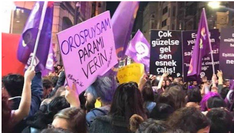
Şekil 3. Feminist gece yürüyüşünden bir pankart

Kodlanan toplam 4192 gönderinin %7'lik (n: 310) kısmını radikal feminist unsurlar içeren pankartların eleştirisi oluşturmaktadır. Bu eleştirilerin büyük çoğunluğu (n: 300) olumsuz iken yalnızca 7 tanesi olumlu ve 3 tanesi nötr içeriğe sahiptir. Açılan pankartlardan özellikle "Sürtüğe Bak", "Yılın En Büyük Sürtüğü", "Yakamadığınız Cadıların Torunlarıyız" ve "Orospuysam Paramı Verin" gibi kasten kışkırtıcı içeriğe sahip olanlarının konuya dikkat çekme ve diyalog başlatma görevlerini yerine getirerek oldukça başarılı oldukları söylenebilir.